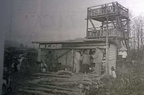
Lintutorni, laavu ja venevalkama muodostavat mukavan ulkokuulekkaan Vanjärven rantaan.