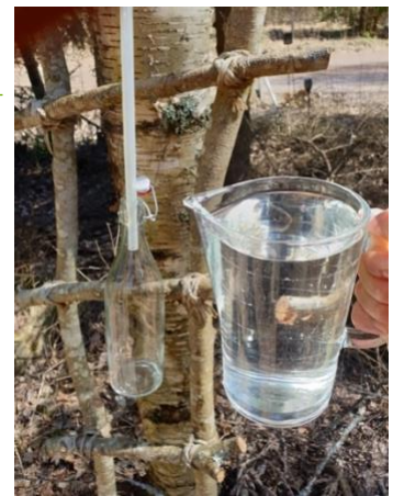
Kotipihan koivusta voi juoksentaa raikkaan terveellistä mahlaa.