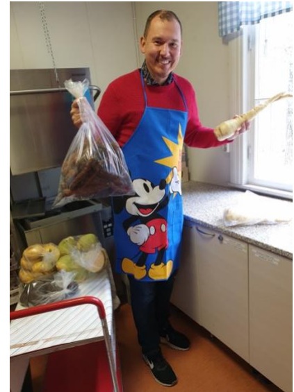
Millaista toimintaa sinä haluaisit Jokikunnalle? Ehdota, tai osallistu mukaan kylätoimikunnan toimintaan. Tehdään Jokikunnasta omannäköinen paikka.