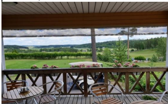
Tänä vuonna kyläkokous järjestetään hulpeissa maisemissa. Kymppikioskin kaunis terassi palveluineen on kesän mittaan avoinna kaikille. Muistathan varoa 10-teelle saapuvien golfaajien avausyöntejä.