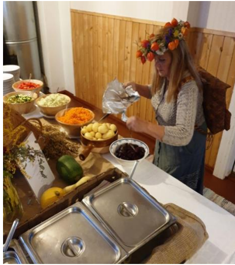
Lokakuussa 2022 kylätoimikunta järjestää sadonkorjuujuhlat seurojentalolla. Aikataulu ja ohjelma varmistuvat lähempänä syksyä.