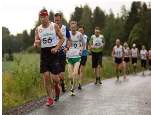
Elokuun ensimmäisenä sunnuntaina 7.8.2022 juostaan perinteeksi muodostunut Koskenniemi-juoksu.