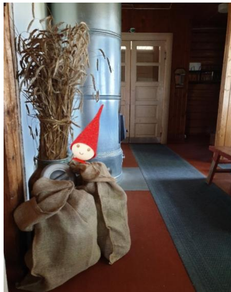
Joulukuussa 9.12.2022 järjestetään jälleen joulujuhlat seurojentalolla.