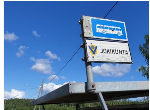
Pidetään Jokikunta viihtyisänä paikkana asua ja elää. Siksi kylätoimikunta haastaa tänäkin vuonna kyläläisiä tarkastelemaan kotipiirin tienvarsien siisteyttä.