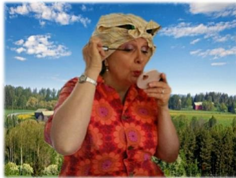
Karjako-Mairen kevätrieska (karjakkokulkueen rieska)

4,5 dl kaurahiutaleita, 8 dl maitoa, 2 dl piimää, 2 tl suolaa, 3 dl puuroriisiä, 4,5 dl vettä, 50 g voita, 2 munaa