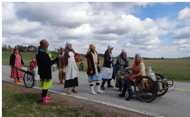
Jokikunnan keväinen karjakkokarnevaali 2022 tuo kylälle iloista tunnelmaa. Tapahtuma on kaikille avoin.

Karjakkokarnevaalit pöyryttävät käyntiin Jokikunnan kesän 2022 lauantaina 21.5 alkaen klo 12.00 . Tapahtuma alkaa Jokikunnan koulun pihalta. Mukana karjako-Maire ja Matti-lehmä.